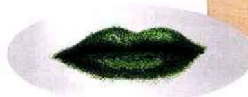
Miroir. Mirror. l 68 x h 170 x p 2,5 cm, design Dino Gavina (2004), Venere – hommage à Man Ray, Paradisoterrestre.