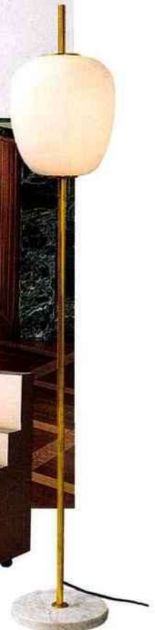
Lampadaire en marbre, laiton et opaline. Marble, brass and opaline lamp. ø 30 x h 185 cm, design Joseph-André Motte (1957), J14, Atelier Pierre Disderot.