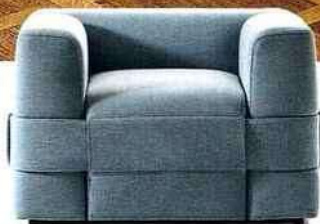
Fauteuil en mousse de polyuréthane et ouate de polyester. Polyester and polyurethane foam armchair. l 97 x h 62 x p 85 cm, design Mario Bellini (1970), MB1 Quartet, Cassina.