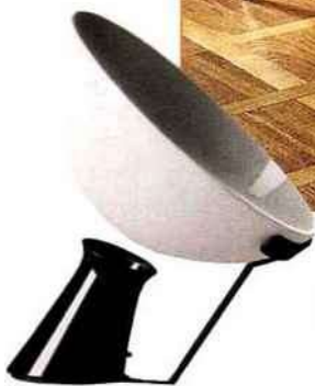
Lampe en aluminium, acier et verre. Aluminum, steel and glass lamp. l 40 cm x h 61 cm, design Angelo Mangiarotti (1988), Aida, Karakter Copenhagen.